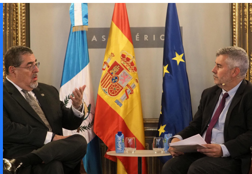
Bernardo Arévalo, presidente de Guatemala

Las Tribunas EFE - Casa de América se han convertido en un referente del análisis de la realidad política, económica y social de América. Continuará siendo parte esencial de la programación de 2026.