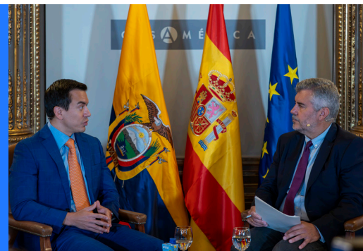
Daniel Noboa, presidente de Ecuador