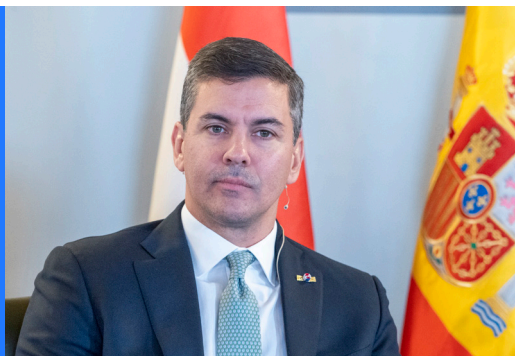
Santiago Peña, presidente de Paraguay